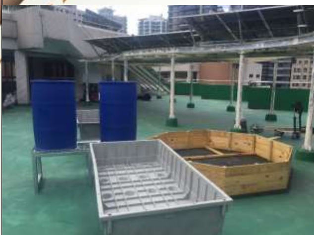
從無到有：建置4樓魚菜共生綠屋頂