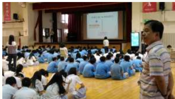
週會宣導魚菜共生