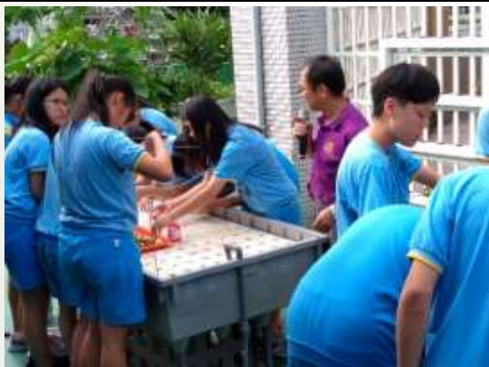
社團課指導學生種植幼苗