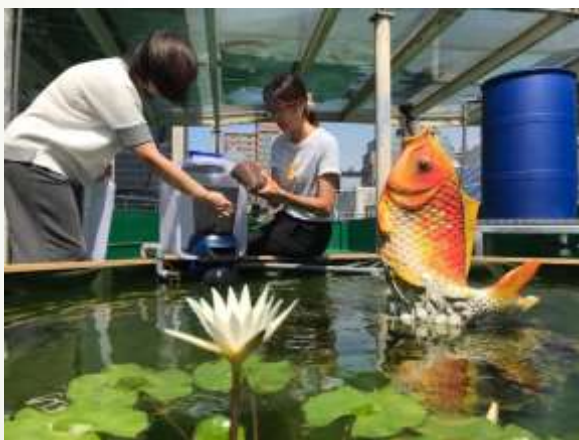
魚菜共生：荷花初綻