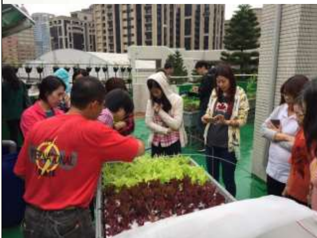
教師魚菜共生增能研習