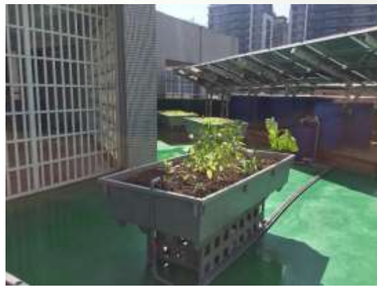
從無到有：建置5樓魚菜共生綠屋頂