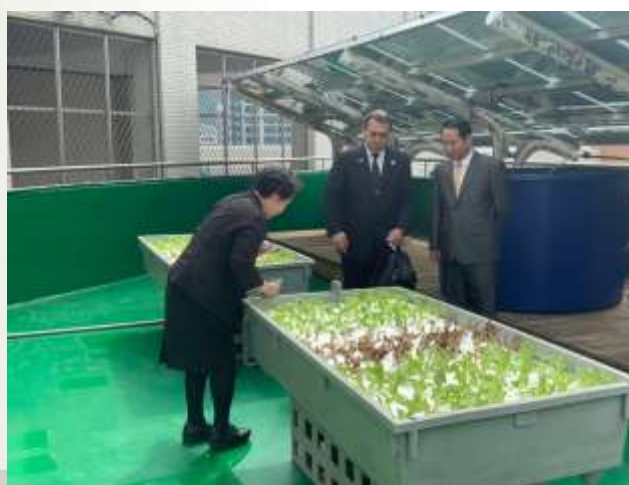
台日交流：日本大學中學校參訪