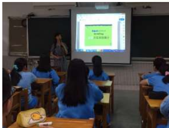
生物課介紹魚菜共生系統